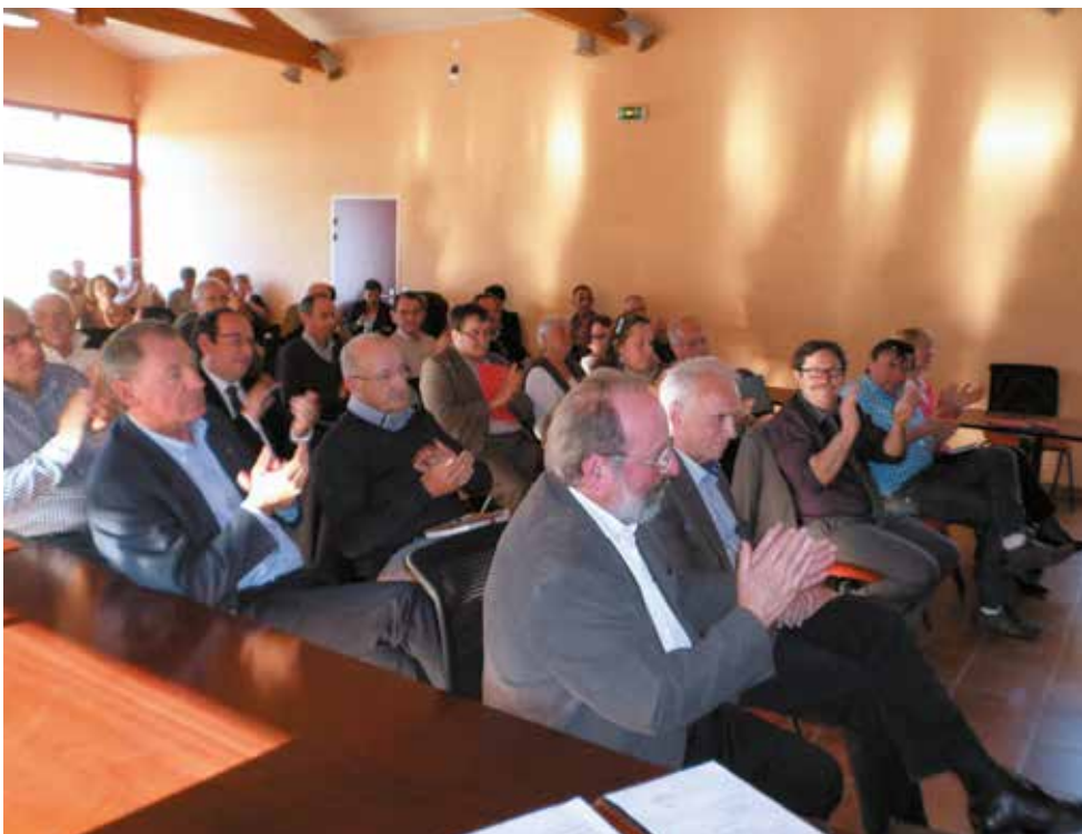
Premier Conseil Communautaire de la nouvelle mandature